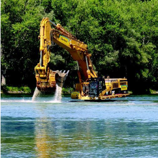
Abb. 3: Baumaschinen in umweltsensiblen Gewässern

3. Mit Urteil vom 02. Mai 2007 (Az.: 5 U 85/06) hat das Hanseatische Oberlandesgericht festgestellt, dass der Verbraucher bei der Auslobung von Produkten mit Umweltbegriffen wie „schnell biologisch abbaubar“ zur Vermeidung ansonsten zu befürchtender Irreführungen aufklärend darauf hingewiesen werden müsse, dass das Produkt – unbeschadet